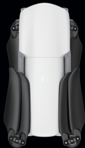
アークティックホワイト

新しいセレクションのドローンカラーでスタイリッシュに飛行。エレガントなアークティックホワイトでドレスアップ。スマートなスペースグレーでレーダーの下も悠々飛行。クラシックなAutel オレンジで未知の世界に大胆に挑戦。